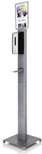
Antibac gulvstativ til dispenserløsninger EPD-nr. 4724985

Veggdispenser for rask og enkel tilgang til de bruksklare klutene i spann. Posen med kluter plasseres i dispenserens, og klutene trekkes enkelt ut gjennom en silikonventil i toppen. Utformet i solid plastkvalitet.