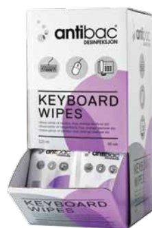
Antibac Keyboard Wipes Servietter i eske à 80 stk. EPD-nr. 4215786

Enkeltpakke servietter for jevn desinfisering av små flater og inventar. Servietter gir dobbel effekt ved at de også fjerner smuss og skitt. Etterlater ingen stoffer på flaten etter fordampning. Leveres i betjeningsvennlig displaykartong som kan plasseres i kantiner, kiosker, på disk, rekvisitarom og lignende.