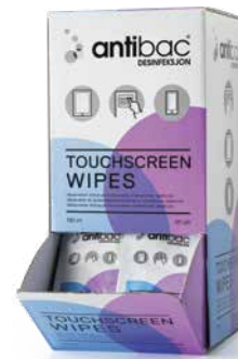
Antibac Touchscreen Wipes Servietter i eske à 95 stk. EPD-nr. 4215794

Enkeltpakke servietter for desinfisering av tastaturer, analoge telefoner, datamus, fjernkontroller, kalkulatorer o.l. Hindrer kryssmitte ved bruk av felles utstyr, og sørger for rene og innbydende arbeidsstasjoner. Leveres i praktisk og betjeningsvennlig displaykartong. Væskemengden er tilpasset bruk på elektronikk.