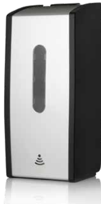
Antibac berøringsfri dispenser til 700 ml bag-in-box, alum.farget EPD-nr. 4050787

Berøringsfri dispenser for bag-in-box 700 ml hånddesinfeksjon og såpe. Gir automatisk og rask dosering av væsken. Motoren drives av 4 stk. AA batterier. For lengre levetid anbefales Litium-batterier.