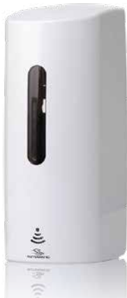
Antibac berøringsfri dispenser til 700 ml bag-in-box, hvit plast EPD-nr. 2652956

Berøringsfri dispenser for bag-in-box 700 ml hånddesinfeksjon og såpe. Gir automatisk og rask dosering av væsken. Motoren drives av 4 stk. AA batterier. For lengre levetid anbefales Litium-batterier.