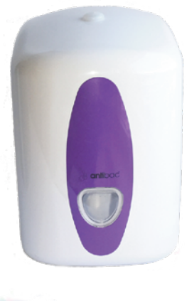
Antibac dispenser til kluter i spann à 300 stk. EPD-nr. 5053996

Berøringsfri dispenser for bag-in-box 700 ml hånddesinfeksjon og såpe. Gir automatisk og rask dosering av væsken. Motoren drives av 4 stk. AA batterier. For lengre levetid anbefales Litium-batterier.