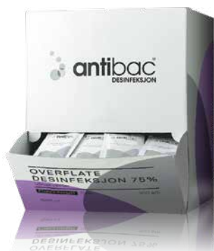
Antibac Overflatedesinfeksjon Servietter i eske à 150 stk. EPD-nr. 4217469

Enkeltpakke servietter for jevn desinfisering av små flater og inventar. Servietter gir dobbel effekt ved at de også fjerner smuss og skitt. Etterlater ingen stoffer på flaten etter fordampning. Leveres i betjeningsvennlig displaykartong som kan plasseres i kantiner, kiosker, på disk, rekvisitarom og lignende.