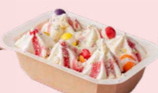
Knas og fjas