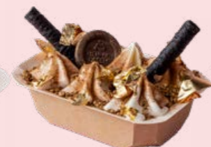
Gull og glitter