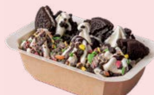
Nonstop & Oreo