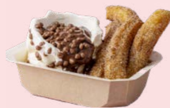
Churros med Softisvulkan