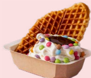
Croffle med Softisvulkan