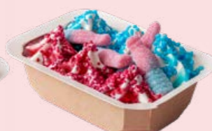
Søt & Sur