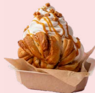
Kanelnurr og softis