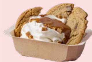
Cookie med Softisvulkan